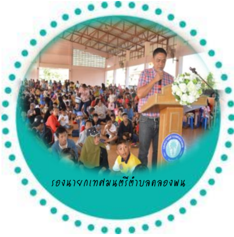
รองนางกเทศมนตรีตำบลคลองพน